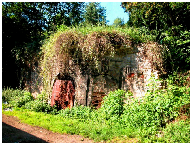
stav před rekonstrukcí

Sala terrena, která se nachází v usedlosti od roku 1704 uváděné pod názvem Popelka, je poslední dochovanou